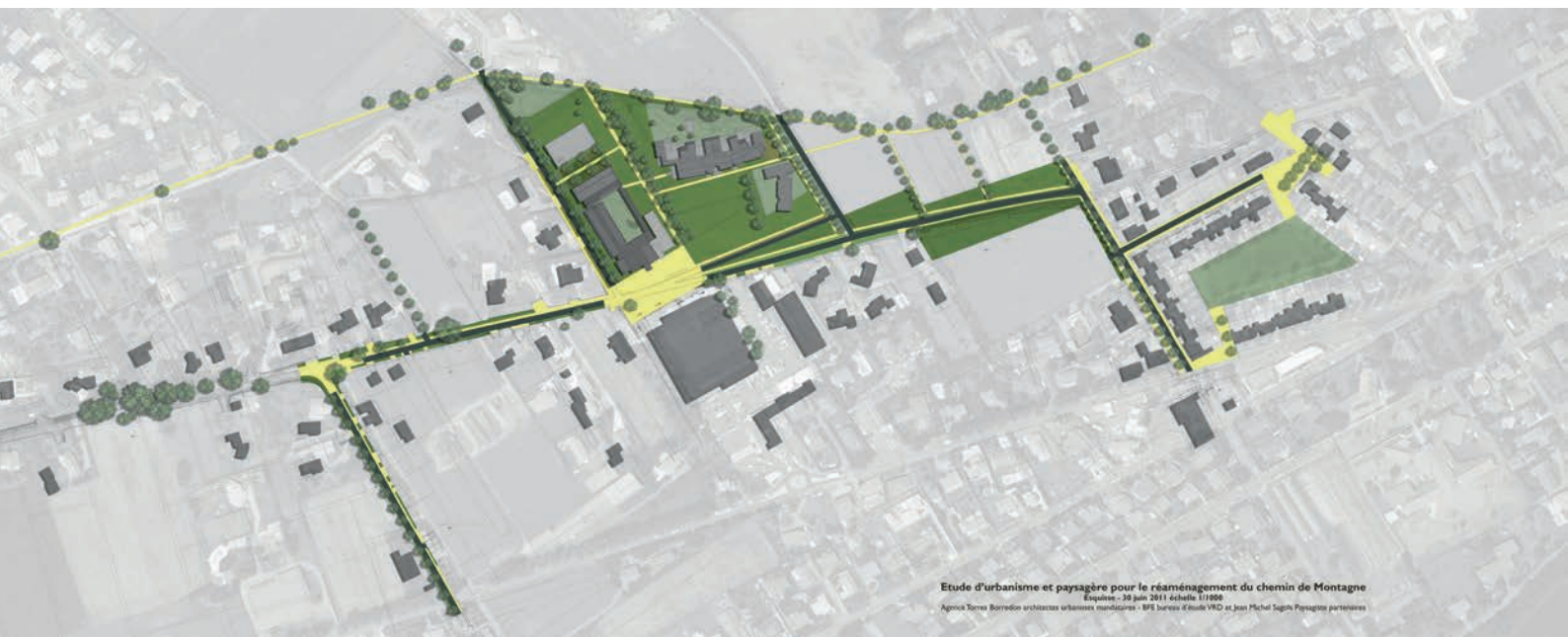
Etude d'urbanisme et paysagère pour le réaménagement du chemin de Montagne Equisane - 30 juin 2011 échelle 1/1000 Agence Terres Boréales architectes urbanistes mandataires - BPE bureau d'étude VPO et Jean Michel Supin Paysagiste partenaire

une crèche, articulés autour d'une plaine de jeux. Le site du projet était à l'origine structuré par des chemins creux devenus des routes bordées de fossés qui alimentaient le ruisseau de Saint-Bernard, identifiable sur les anciens cadastres. Partiellement busé, cet affluent de la Save avait disparu (sa source a été remise en évidence lors des travaux) et l'exutoire contraint imposait une grande maîtrise des débits de fuite en amont.