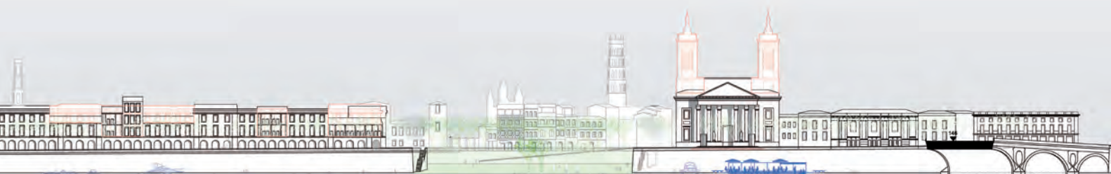
Projet Saget XVIII e siècle pour la façade de la Garonne ; en couleur les interventions réalisées